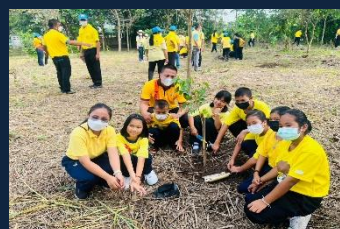
โครงการ/กิจกรรมด้านสิ่งแวดล้อม