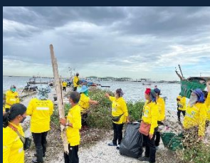
โครงการ/กิจกรรมกำจัดมูลฝอย น้ำเสีย