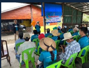
โครงการ/กิจกรรม เสริมสร้างความรู้ฝึกรวม