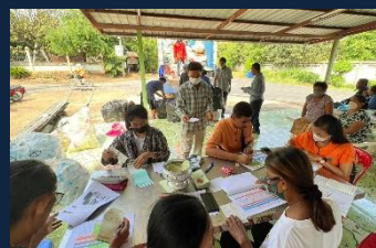
โครงการ/กิจกรรม ขับเคลื่อนธนาคารขยะ