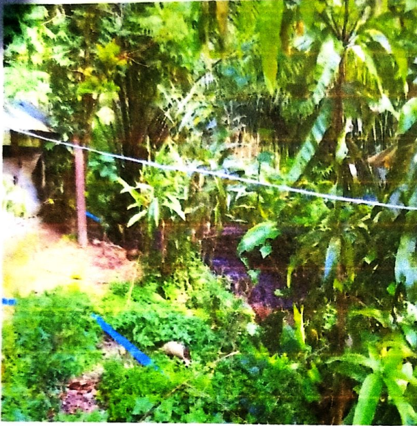
ภาพการตรวจติดตามการแก้ไข เรื่องร่องทุกซ์/ร่องเรียน กรณีได้รับความเดือดร้อนจากกลิ่นมูลสุกร เมื่อวันที่ ๘ มีนาคม ๒๕๖๕ เวลาประมาณ ๑๐.๓๐ น.